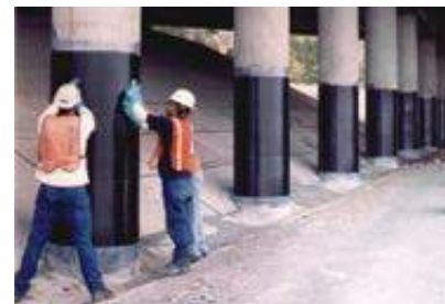
(a) réparation de poteaux en béton armé par collage de composites

Bref descriptif : Ce stage s'inscrit dans la continuité de travaux menés conjointement à d'Alembert et à l'IFSTTAR sur la modélisation du comportement de structures en béton armé ayant fait l'objet de réparations par divers moyens de confinement (chemisage métallique, tissus composites collés (a)) en vue de répondre aux nouvelles normes parasismiques.