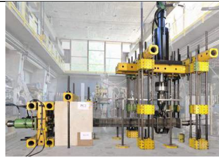
(c) dispositif de flexion composée sur poteau en béton armé confiné (IFSTTAR)

La deuxième étape du travail consistera en la poursuite des calculs de ce type engagés par C. Farahmandpour. On s'attachera tout d'abord à reproduire des essais expérimentaux sur la flexion composée oligocyclique alternée de poteaux en béton armé pour lesquels la partie ductile et adoucissante de la courbe enveloppe n'est à l'heure actuelle que partiellement reproduite. L'une des pistes envisagées pour améliorer la qualité des simulations est l'introduction d'une loi d'interface entre le poteau et le moyen de confinement dans le but de retarder la localisation de l'endommagement dans les zones les plus sollicitées