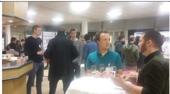
souvenirs du workshop CSMA Juniors 2018